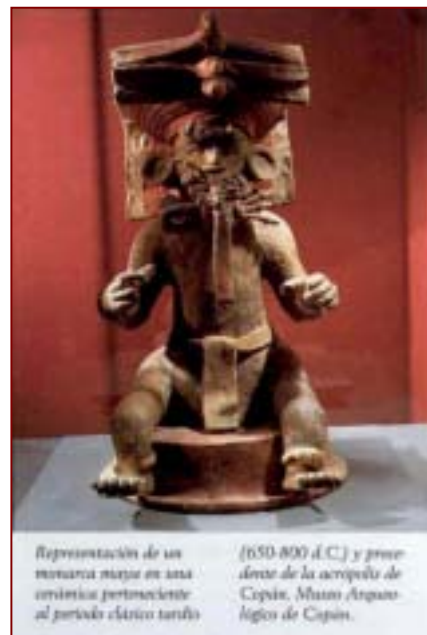
Representación de un monarca maya en una cerámica perteneciente al período clásico tardío (650-800 d.C.) y procedente de la acrópolis de Copán, Museo Arqueológico de Copán.

Las vasijas policromadas son una de las que demuestran el alto grado de desarrollo de la cerámica maya de copan.