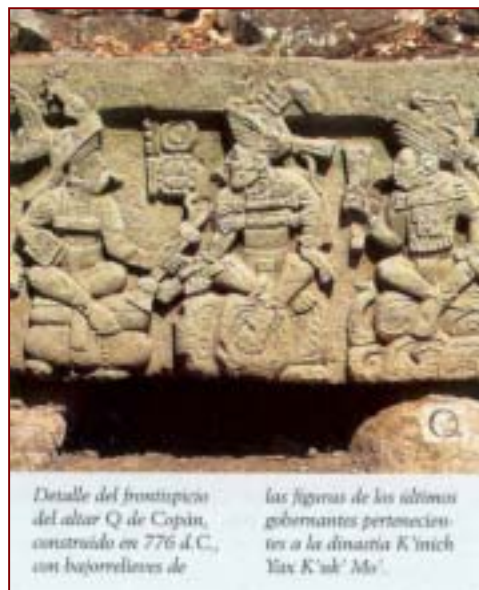
Detalle del frontispicio del altar Q de Copán, construido en 776 d.C., con basorrelieves de

Debido a las marcadas diferencias que presentan las distintas regiones mayas, los recursos naturales eran muy variados. Como dijimos, para las necesidades básicas de las poblaciones cada región sólo era parcialmente autosuficiente. No faltaban maíz y frijoles en ninguna ciudad, ni tampoco madera y palmas para construir las chozas, pero ciertos productos sólo se obtenían en determinados medios geográficos. De ahí el nacimiento de un intenso comercio interior dentro del área global y de un comercio exterior con pueblos no mayas. Ellos comercializaban con cacao que era su principal producto artículos de cuero, cestas, tejidos bordados cerámica pintada, miel, cera, pescado, venados, armas, sal etc. Este se realizaba por vías terrestres (utilizando simples veredas o caminos de piedra) vía fluvial