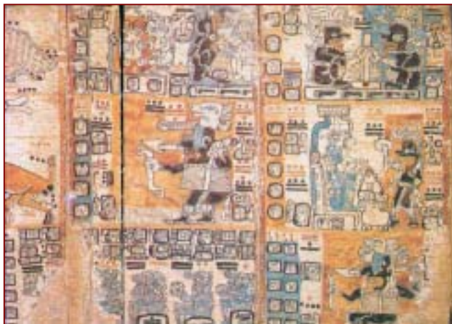
Fragmento del Códice Cortesiano conservado en el Museo de América de Madrid. El estudio de los códices proporcionó las claves para descifrar una parte importante de los jeroglíficos mayas.

De todas las civilizaciones indígenas de América, sólo la maya desarrolló un verdadero sistema de escritura en el que los caracteres ya no eran meramente pictogramas o figuras mnemotécnicas; la escritura se hallaba ya en proceso hacia un sistema fonético, al pasar los símbolos a representar sonidos, más que objetos o ideas. No obstante, los caracteres no contienen un cuadro de la idea, sino un símbolo de la misma, siendo algo más que símbolos convencionales.