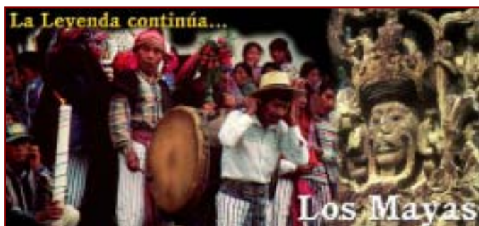
- Banner impreso 35" x 17"