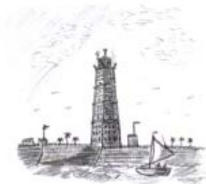
Faro de Alejandría

El bibliotecario Calímaco De Cirene (305 – 240 a. C.) de la ciudad egipcia de Alejandría, escribió alguna vez una obra titulada “Una colección de maravillas terrestres a través del mundo” que, sin que él lo hubiera previsto, inició la carrera de un mito que trascendería a través de los siglos. Aunque no llegó a nuestros días copia alguna del original, el mundo supo de su existencia a través de referencias de otros autores sobre esta