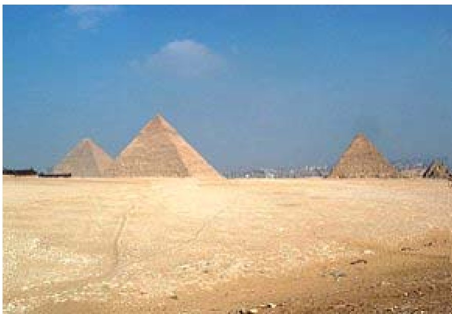
Pirámides de Gizeh en la actualidad.

Sucedió que al morir Alejandro Magno contando solamente con 33 años - en el 323 a. C.- no dejó un sucesor, y esto hizo que la unidad política que él había logrado, no tardara en quebrarse. Sus generales lucharon durante años para adueñarse del poder de todos los extensos territorios conquistados. Aprovechando esta situación, muchas ciudades griegas pretendieron lograr, o recobrar su independencia. Esta fue la intención de los gobernantes de la isla, y entonces decidieron enfrentar al rey macedonio Demetrio Poliorcetes, que era conocido por su experiencia en la estrategia militar, sobre todo en la técnica de los asedios a ciudades y fortalezas. Los rodios asombraron al mundo antiguo venciendo al temible macedonio, al que hicieron huir, junto con su ejército, abandonando enormes cantidades de armas y escudos de bronce.