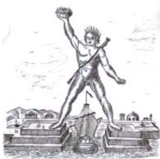
Coloso de Rodas

que reflejara la inmensa gloria de la ciudad, y sirviera de homenaje a Apolo. El escultor se puso a trabajar de inmediato y diseñó una figura con una portentosa antorcha en su mano, que representaría al dios Helios, el dios del día, de la luz y de la armonía, tendría más de 30 metros de altura, y se levantaría a la entrada del puerto de Rodas. El tiempo comenzó a correr y la estructura fue creciendo ante los ojos de los azorados rodios que no podían creer lo que veían. Ceres construyó primeramente un gigantesco armazón de hierro sobre el cual luego fueron colocando las placas de bronce. Doce años después, en el año 280 a. C. la estatua se concluyó y contó con una altura de 32 metros que hacía visible todo su esplendor desde grandes distancias, aunque no la pudo ver su propio creador, ya que antes de concluirla se suicidó al haber enloquecido pensando que había hecho un trabajo deficiente y que su obra se derrumbaría de inmediato. El discípulo Lacho concluyó lo que doce años antes había iniciado su malogrado mentor.