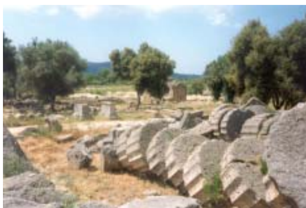
Vista general del estado actual de las ruinas de Olympia.

Unos cincuenta años después de la muerte de Alejandro, alrededor del año 274 a. C., el rey Tolomeo II impulsó la construcción de una torre de mármol en la isla de Pharos, a unos 14 km de la costa, con el objeto de guiar a las embarcaciones que llegaban al puerto de Alejandría, y encargó su construcción al arquitecto griego Sostratos. Esta torre,