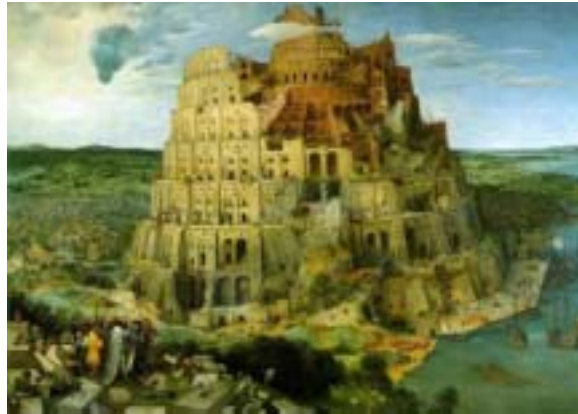
Torre de Babel en Babilonia, según Brueghel, obra que dataría de la época de los jardines...

Sólo una de estas excepcionales obras maravillosas se encuentra en pie en nuestros días. Se trata de las pirámides de Egipto y a raíz de esta situación comienzan las especulaciones sobre los motivos por los cuales esto ha sido posible, mientras que ninguno de los otros seis monumentos ha permanecido a través del tiempo, pero también se refuerza la necesidad de conocer las razones por las cuales las otras han desaparecido.