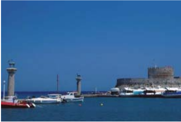
Puerto de Rodas donde se encontraba el Coloso.

Hay que pensar que si no hubiera sido por historiadores y cronistas adoradores de la belleza de las formas y de la búsqueda de la verdad de los acontecimientos pasados, quizá las noticias de la existencia de más de una de las siete maravillas no