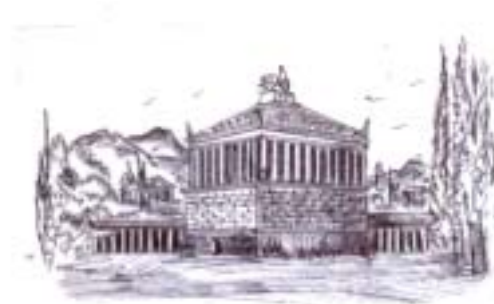
Mausoleo de Halicarnaso

La historia de la reina enamorada del rey Mausolo, proviene de una tradición contada por el historiador Plinio el viejo, que afirmaba haberla leído en un libro escrito por dos testigos presenciales de los hechos, nada menos que dos de los arquitectos griegos que participaron de la construcción del impresionante monumento. Plinio contó que poco después de la muerte del rey de Caria, arribó a Atenas una comitiva enviada por la reina Artemisia II, con el objeto de contratar a un equipo de trabajo que hiciera realidad su sueño de inmortalizar a su amado muerto. El equipo contratado llegó a la ciudad de Halicarnaso al poco tiempo, y estuvo conformado por los arquitectos Pytheos y Satyros –aquellos que habrían escrito el libro leído por Plinio–, y los escultores Scopas, Briaxis, Leocares y Tymoteo. Primeramente, con mano de obra esclava se llevó a cabo la preparación del terreno, y luego se pusieron a trabajar los recién llegados. Los arquitectos construyeron una enorme base cuadrangular donde probablemente